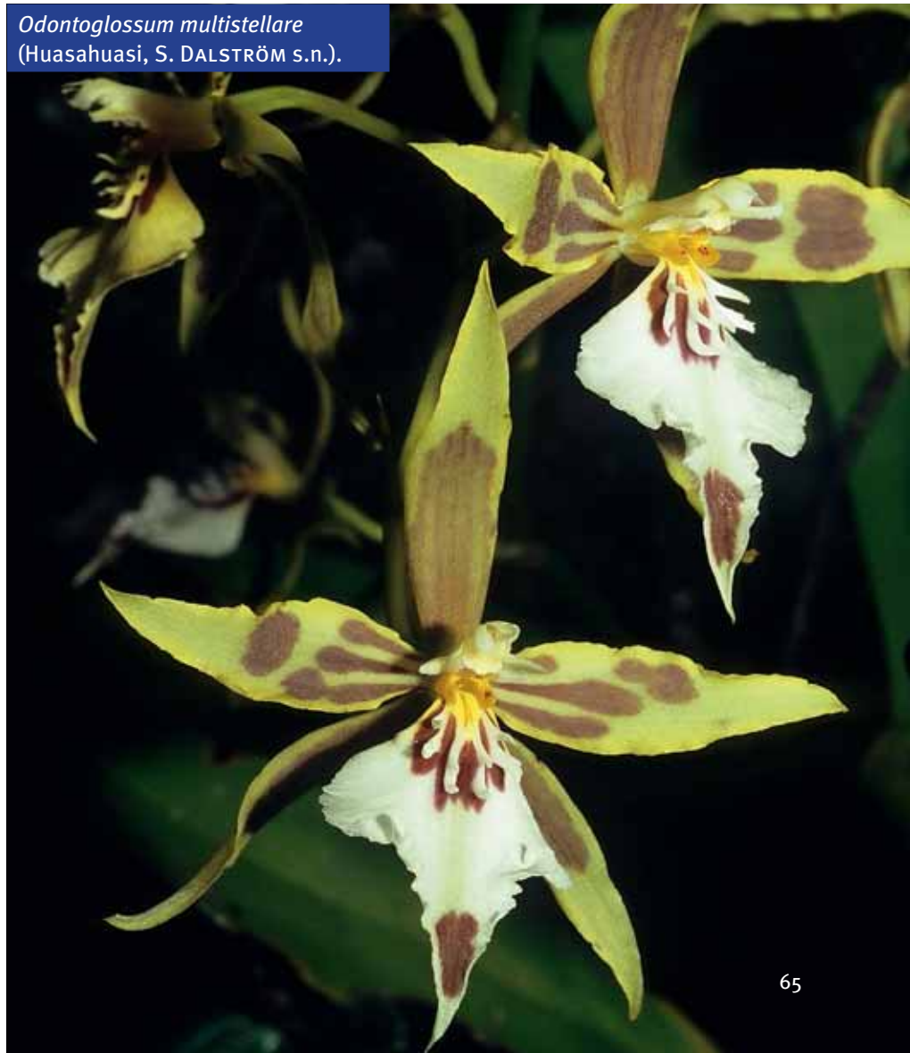
Odontoglossum multistellare (Huasahuasi, S. DALSTRÖM s.n.).