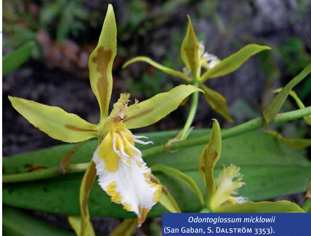
Odontoglossum micklowii (San Gaban, S. DALSTRÖM 3353).

with a larger and slightly diverging, unevenly dentate pair of keels reaching almost half the length of the lamina; column basally whitish and apically yellowish green, stout, straight, basally pubescent, ventrally canaliculate with large, slightly involute lobes below the stigma, a short trunk-like ros-