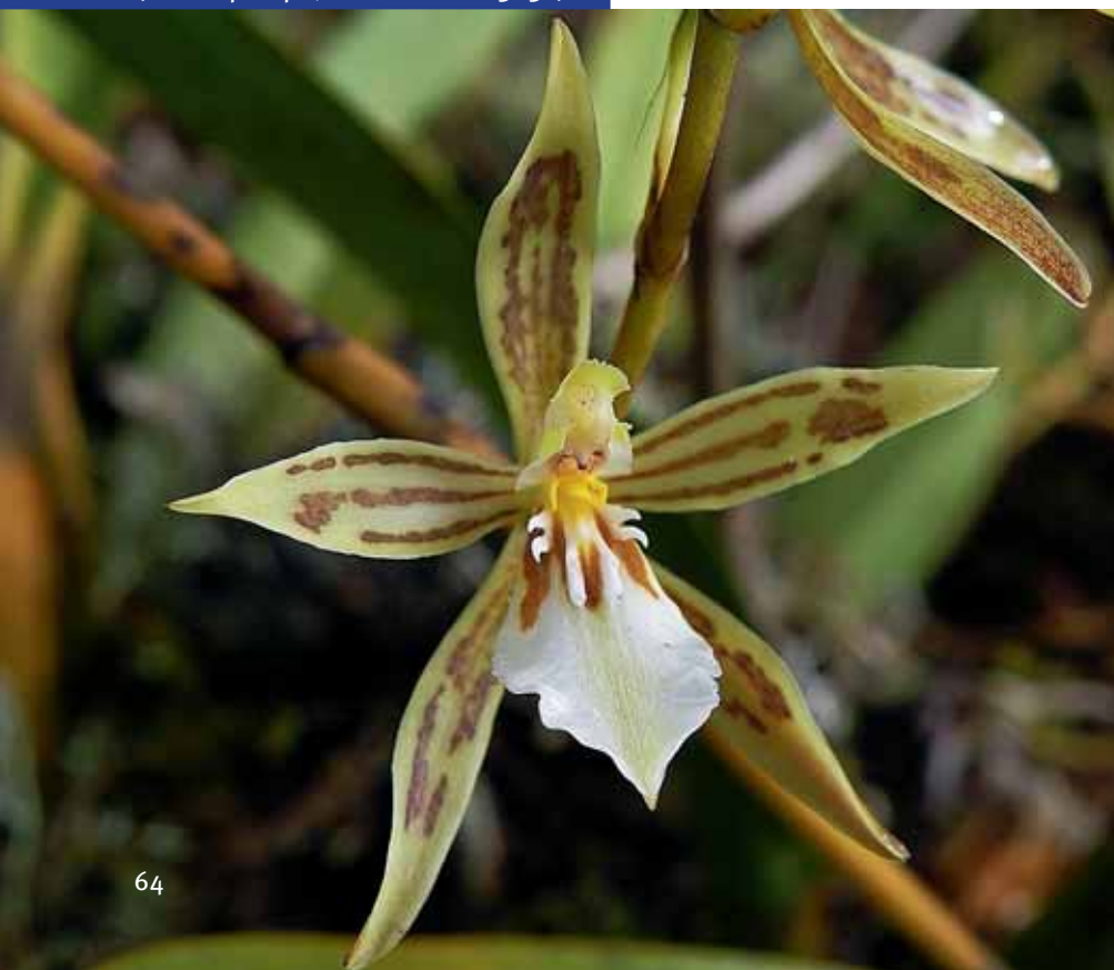
Odontoglossum astranthum (Molinopampa, S. DALSTRÖM 3232).

hat zu den relativ neuen Beschreibungen von Odontoglossum dracoceps DALSTRÖM (1999) und Odontoglossum micklowii DALSTRÖM (1993) geführt. Wir beschreiben jetzt hier einen weiteren Vertreter dieser veränderlichen Gruppe, der wahrscheinlich nicht der letzte sein wird, der einen