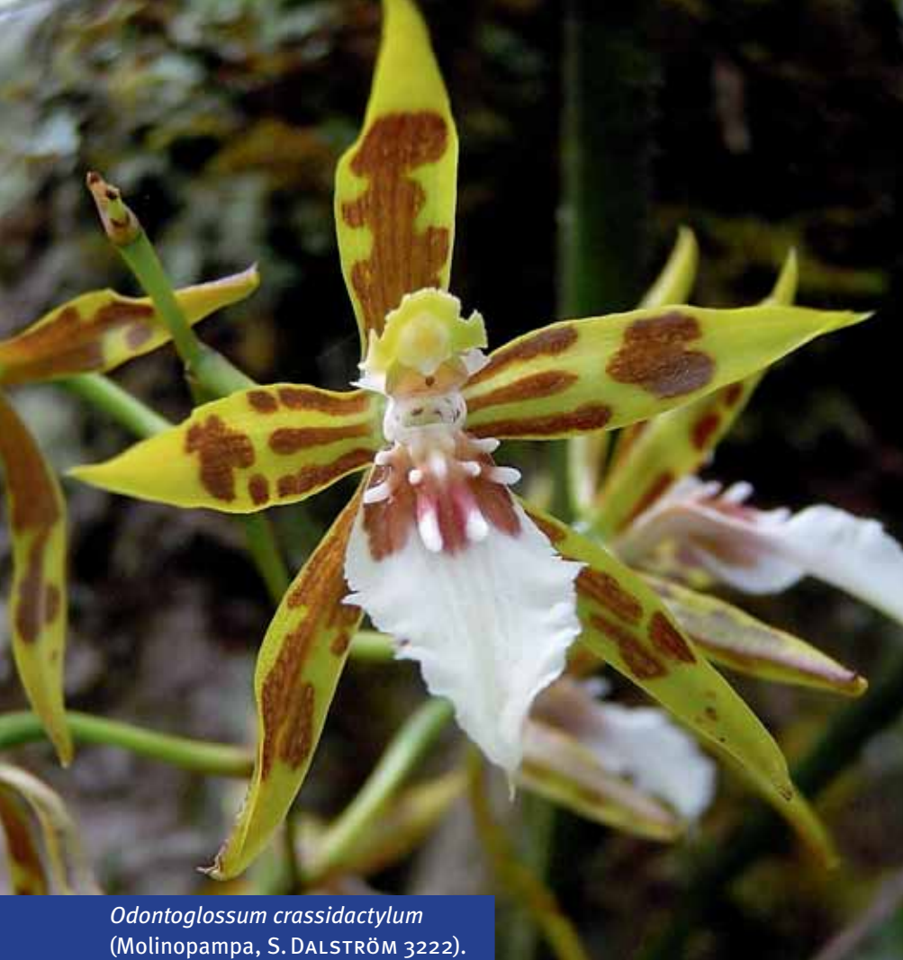
Odontoglossum crassidactylum (Molinopampa, S. DALSTRÖM 3222).

pe ist der Odontoglossum astranthum -Komplex. Lediglich nach umfassenden Felduntersuchungen war es möglich, die Beschreibungen der einzelnen Arten zu verstehen, um sie taxonomisch adäquat zu behandeln. Diese Arbeit